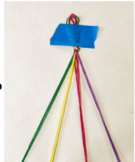
Guía de inicio