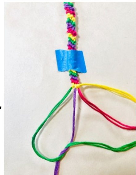
Hacer un "enganche adelantado"